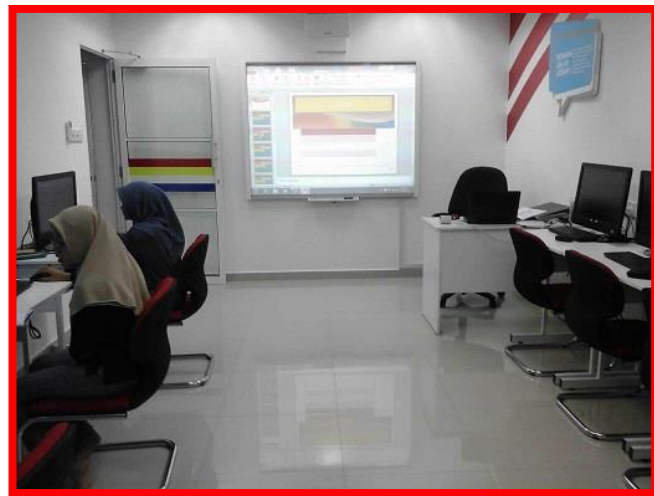
2.1 Peserta sedang mengikuti kelas Asas Microsoft office 2010 dan Internet.