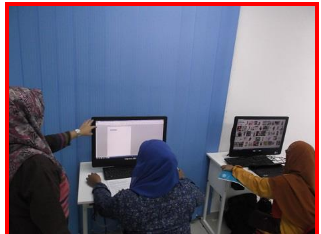
3.1 Peserta sedang mengikuti kelas keusahawanan dari petugas PI1M.