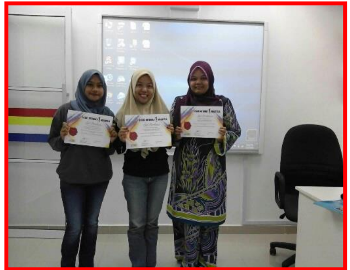
1.1 Peserta sedang mengikuti kelas INTEL Microsoft office 2010.