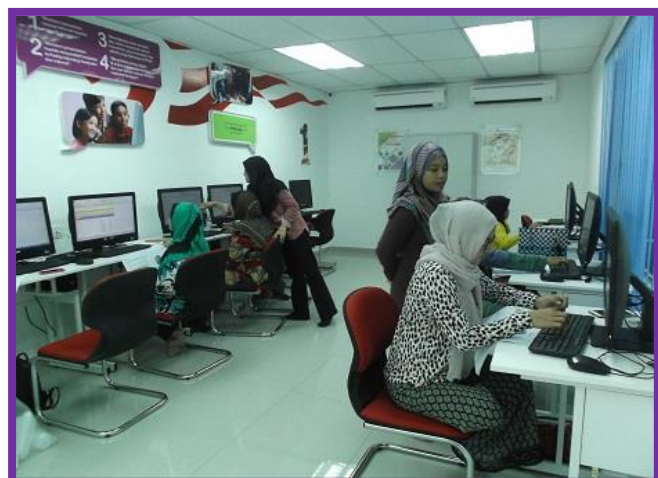
2.1 Peserta sedang mengikuti kelas Asas Microsoft office Word dan Excel 2010