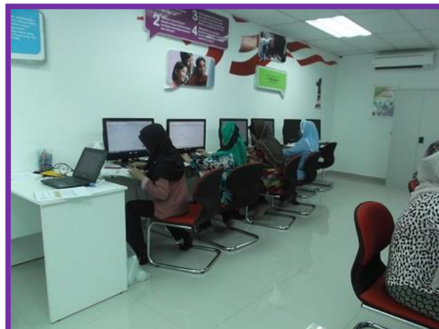
1.1 Peserta sedang mengikuti kelas INTEL Microsoft office Word dan Excel 2010.