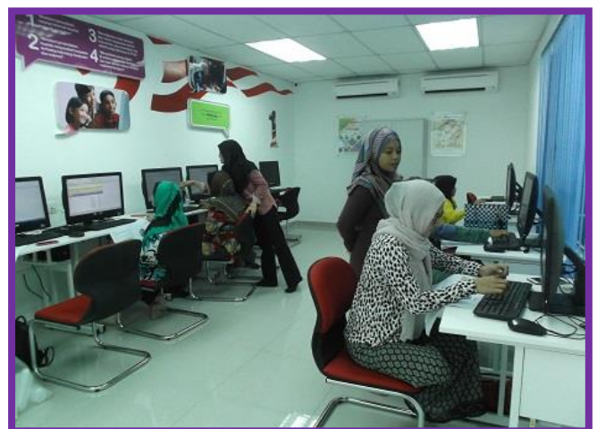
4.1 Peserta sedang mengikuti kelas keusahawanan dari petugas PI1M.