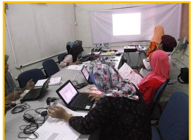
4.0 Peserta sedang mengikuti kelas Microsoft Office Power Point 2010