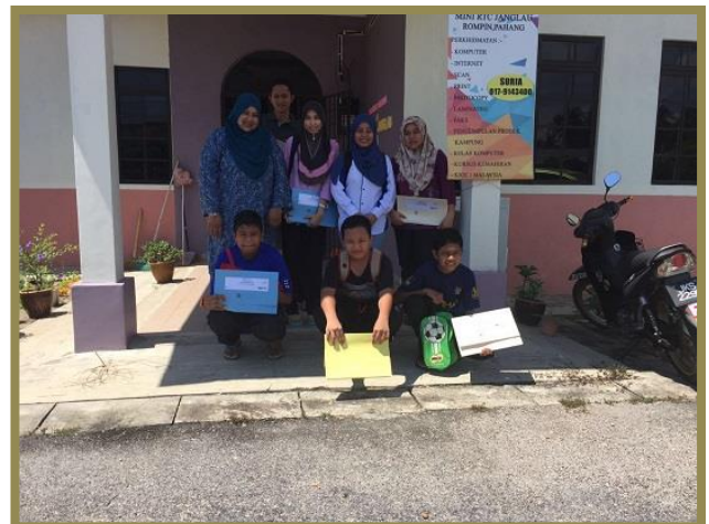
2.0 Peserta sedang mendengar taklimat dan belajar cara-cara membuat blog daripada petugas pusat internet.