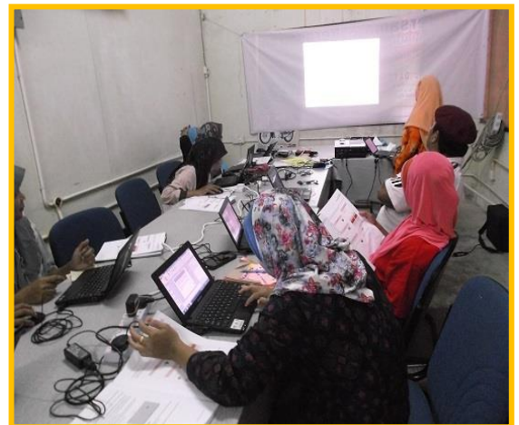
5.0 Peserta sedang mengikuti kelas keusahawanan Microsoft office power point 2010