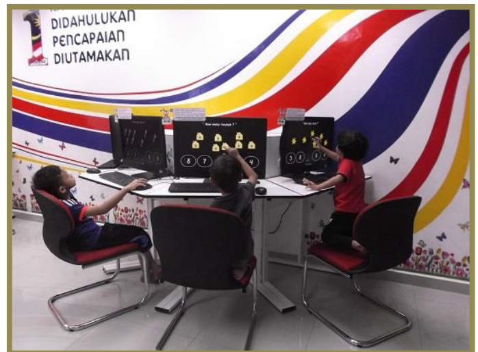
3.0 Para pelajar sedang mengikuti kelas e-pembelajaran