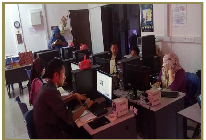
1.0 Peserta sedang mengikuti taklimat tentang cara-cara membuat e-mel menggunakan e-mel gmail.