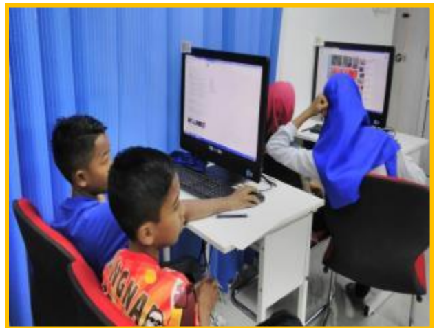
4.1 Peserta sedang mengikuti kelas asas membuat video