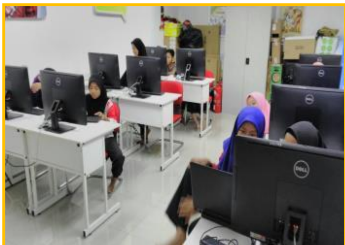
5.1 Peserta sedang mengikuti kelas e-pembelajaran