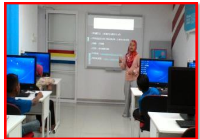
1.1 Peserta sedang mengikuti taklimat literasi digital klik dengan bijak