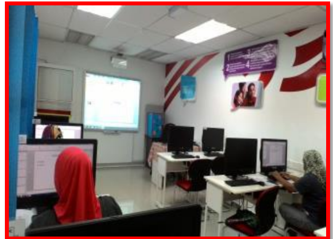
2.1 Peserta sedang mengikuti program Latihan Keusahawanan