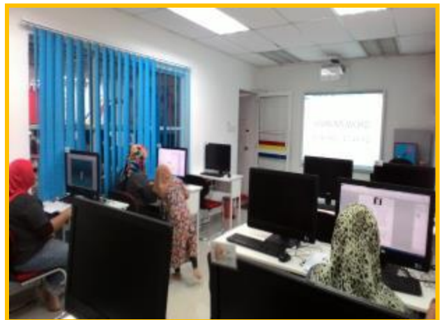
3.1 Peserta sedang mengikuti kelas Microsoft Office 2010